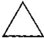
Tejas - Triângulo Vermelho

Como tivemos oportunidade de mencionar, o Akasha, ou Princípio Etérico, é a origem da criação dos elementos. O primeiro elemento que de acordo com os escritos orientais nasceu do Akasha, é Tejas, o princípio do fogo. Esse elemento, como todos os outros, não age só em nosso plano denso, material, mas em tudo o que foi criado. As características básicas do princípio do fogo são o calor e a expansão; é por isso que no começo da criação tudo era fogo a luz. A bíblia também diz: "Fiat lux - que se faça a luz". Naturalmente a base da luz é o fogo. Cada elemento, inclusive o fogo, possui duas polaridades, a ativa e a passiva, Le., Plus a Minus (mais a menos). A Plus é a construtiva, criadora, geradora, enquanto que a Minus é a desagregadora, exterminadora.