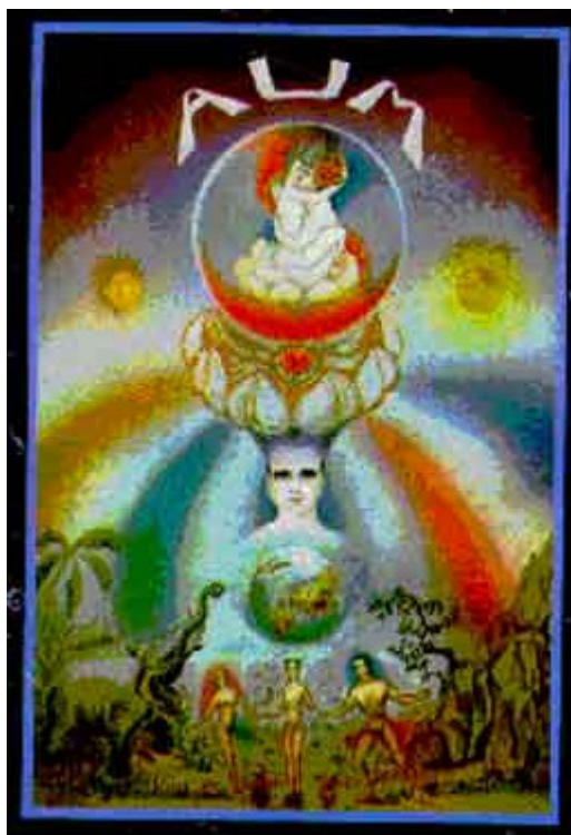
A Primeira carta do Tarô. Explicação do seu simbolismo.

Os reinos mineral, vegetal a animal, estão simbolicamente expressos na parte inferior da carta.