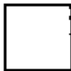
Prithivi - Quadrado Amarelo

Já dissemos que o princípio do ar não representa propriamente um elemento em si, e essa afirmação vale também para o princípio da terra. Isso significa que, do efeito alternado dos três elementos mencionados em primeiro lugar, o elemento terra formou-se por último, pois através de sua característica específica, a solidificação, ela integra em si todos os outros